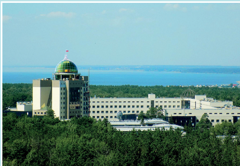
Так выглядит новый университетский кампус (вид сверху). Завершающий этап строительства.

Губернатор Владимир Городецкий выразил уверенность в том, что открытие нового корпуса даст дополнительный импульс нашему университету и еще больше расширит его потенциал.