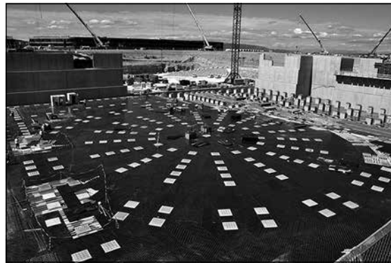
Сейсмостойкий фундамент здания, в котором будет располагаться установка.