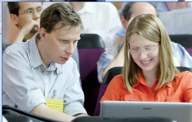
Фото в номере Н. Купиной.