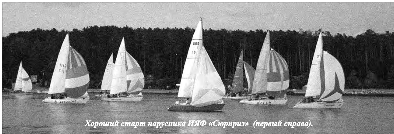
Хороший старт парусника ИЯФ «Сюрприз» (первый справа).