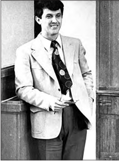
Защита докторской диссертации. 1976 г.