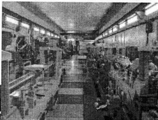
а так он выглядит сейчас (2001 год).

лись наиболее крупные заказы по накопительно-охладителю — магнитная и вакуумная системы. В 1999 году первый модуль форинжектора был собран, и начались очень важные для нас испытания ускоряющей структуры на предельный