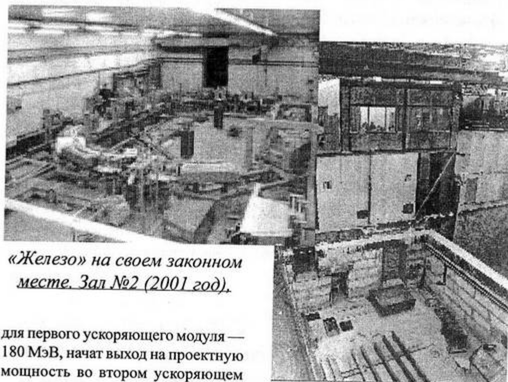
«Железо» на своем законном месте. Зал №2 (2001 год).

для первого ускоряющего модуля — 180 МэВ, начат выход на проектную мощность во втором ускоряющем модуле. При работе с пучком длительностью 130 нс в первом ускоряющем модуле был ускорен заряд 327 нК, что практически гарантирует для ЛУЭ-200 достижимость проектных параметров (к большой радости наших коллег из Дубны). Но самое важное достижение — начало работы в одногустковом режиме, который является для нас основным. В первом же эксперименте удалось получить в одном густке практически половину проектного числа электронов.