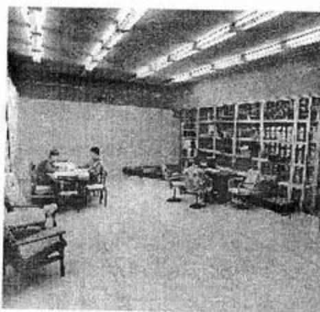
В пультовой пока еще очень просторно (1994 год).