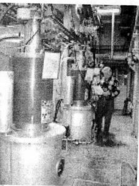
Только «старожилы» комплекса помнят клистронную галерею такой, как на снимке слева (1993 год).

Читатель уже обратил внимание на отсутствие фамилий в этой статье. За прошедшие годы сотни людей участвовали в создании комплекса ВЭПП-5. Очень бы хотелось перечислить их всех поименно, но для этого потребовался бы специальный выпуск «Энергии-Импульс».