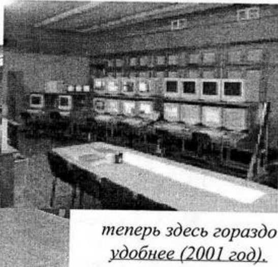
теперь здесь гораздо удобнее (2001 год).