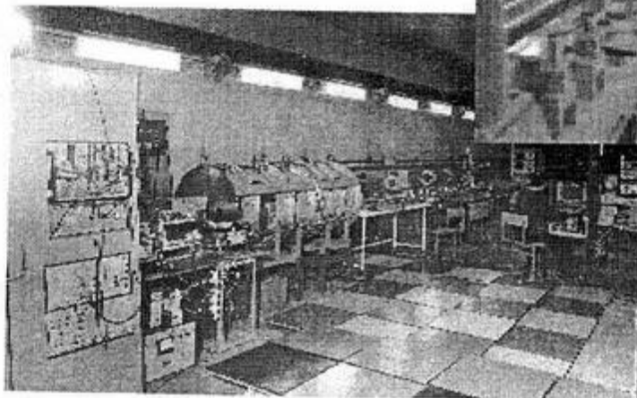
Таким был зал №1 семь лет назад (1994 год).

спаяна на старом термовакуумном участке в ЭП-1. В 1995–1997 годах шла интенсивная работа по созданию нового участка чистых вакуумных технологий, где впоследствии были произведены практически все вакуумные элементы форинжектора. Одновременно создавались источники импульсного питания клистронов – модуляторы.