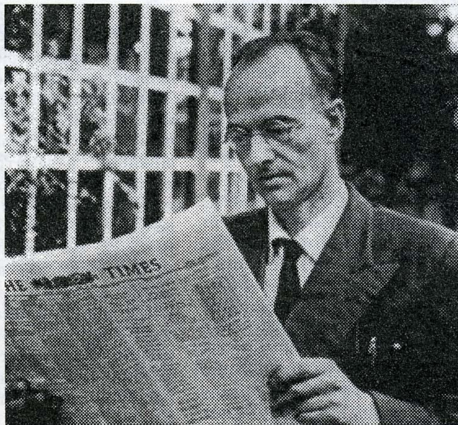
Кlaus Fuchs — английский физик немецкого происхождения. Внес существенный вклад в программу "Супера" в Лос-Аламосе до своего возвращения в Англию в 1946 году. Он также передал секреты атомной и термоядерной бомб Советскому Союзу. Снимок сделан в Западной Германии в 1960 году после девятилетнего тюремного заключения в Англии и восстановления в гражданских правах.

23 апреля 1948 года Л.П. Берия поручил Б.Л. Ванникову, И.В. Курчатову и Ю.Б. Харитону тщательно проанализировать материалы и дать предложения по организации необходимых исследований и работ в связи с получением новых материалов. Заключение по новым материалам К. Фукса были представлены Ю.Б. Харитоновым, Б.Л. Ванниковым и И.В. Курчатовым 5 мая 1948 года. Предложения Б.Л.