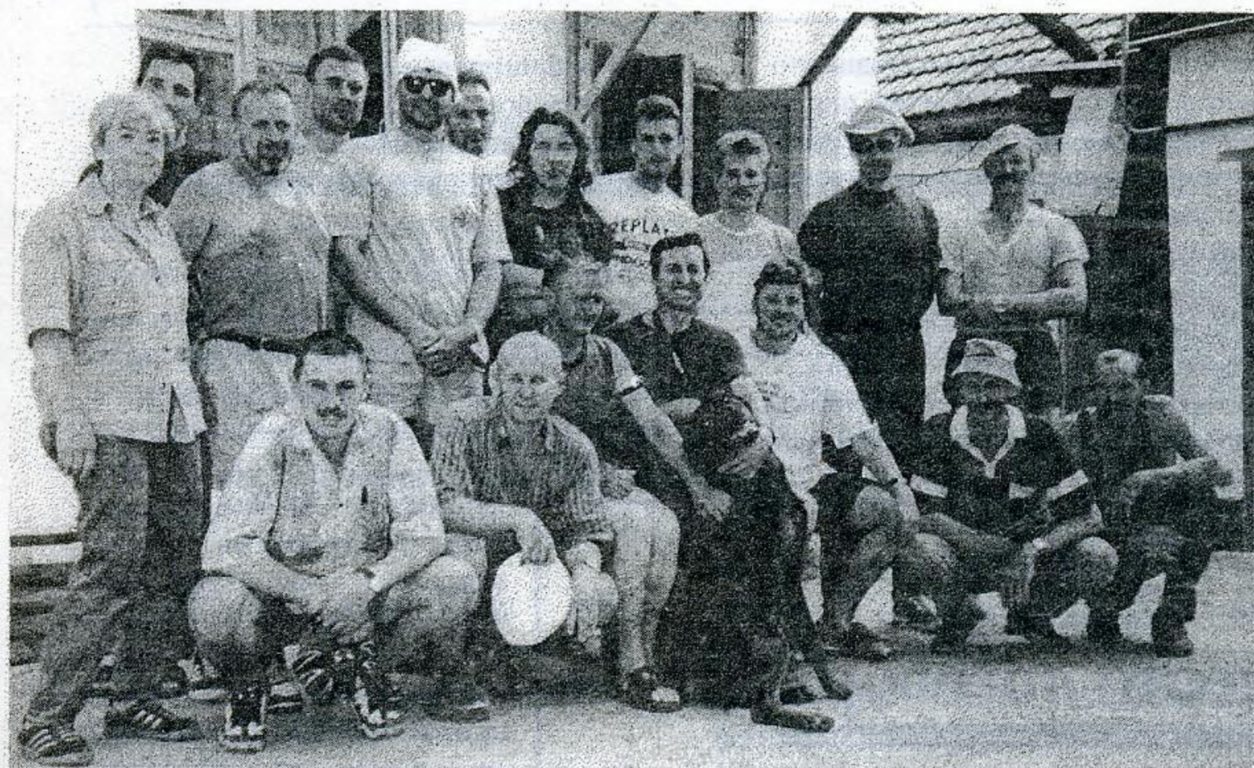
Бишкек, 24 июня: вся команда в сборе.