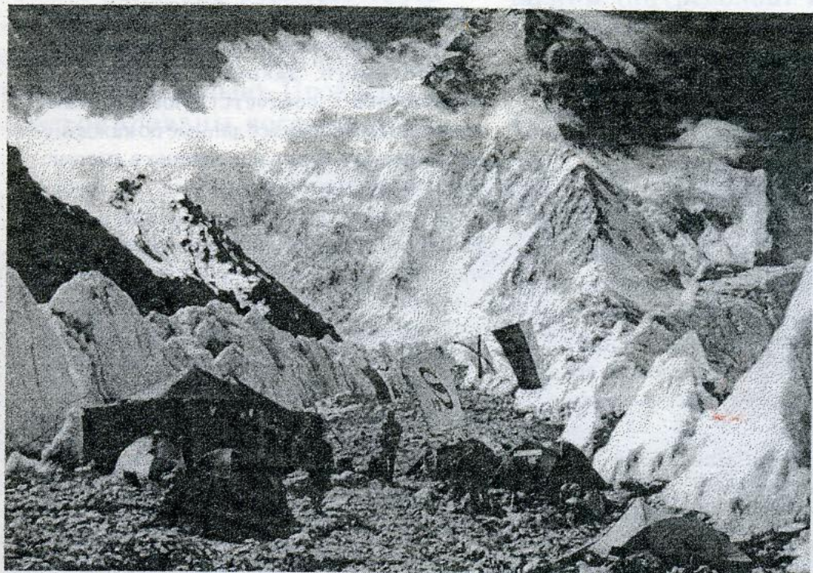
Базовый лагерь у подножия вершины зажат между двумя рядами сераков.

Газета издается ученым советом и профкомом ИЯФ СО РАН. Печать офсетная. Заказ N76