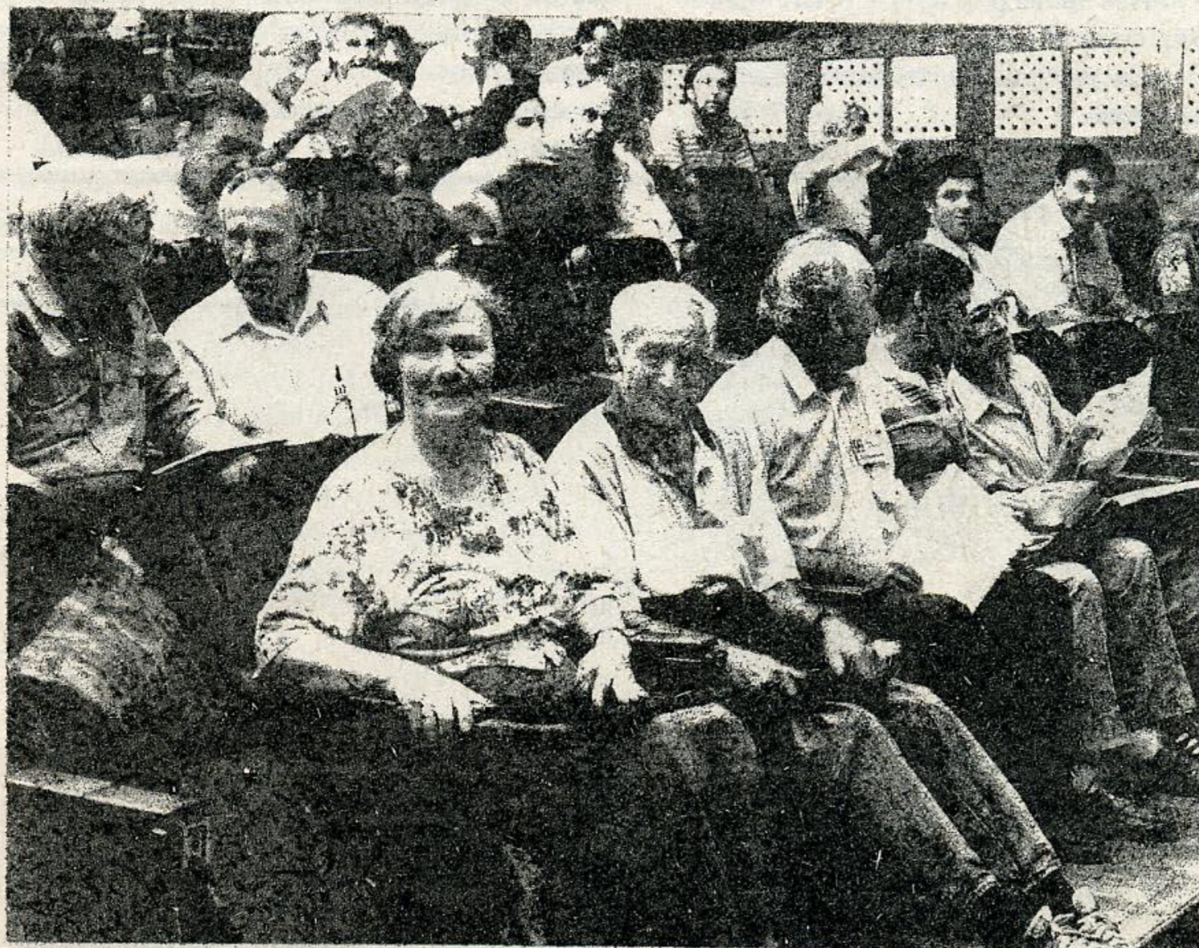
Открытие конференции. Фоторепортаж на 1-3 страницах В. Петрова.