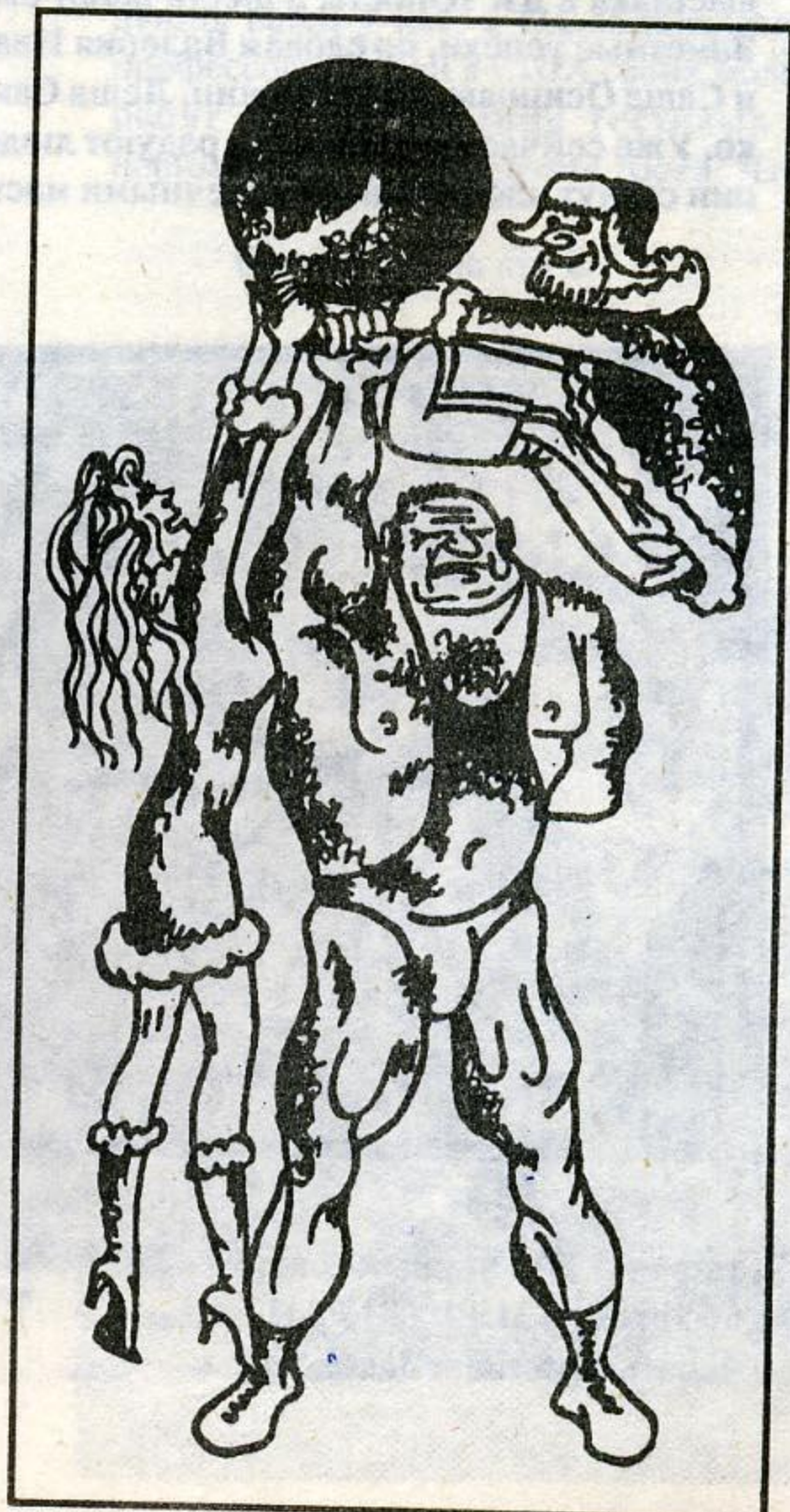
Рис. Е. Бендера

Мне не хотелось бы, чтобы у читателя сложилось впечатление, что человек, достигший определенного возраста или имеющий данный диагноз, попадает в фатальную ситуацию. В настоящее время существуют достаточно эффективные методы профилактики ИБС, ее своевременной диагностики и лечения. Этим вопросам мы предполагаем посвятить дальнейшие публикации в нашей газете.