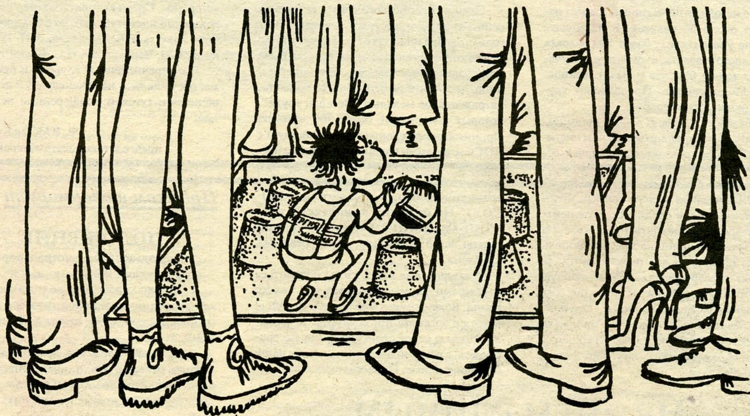
Рисунок Е. БЕНДЕРА.

В наше тяжелое во всех отношениях время особенно важно чувствовать уверенность в себе и своих силах. Этому способствует выработанное для членов клуба оптимистов в Колорадо Спрингс