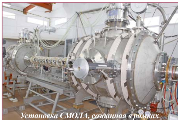
Установка СМОЛА, созданная в рамках комплексной программы РНФ, работа над которой завершилась в уходящем году.