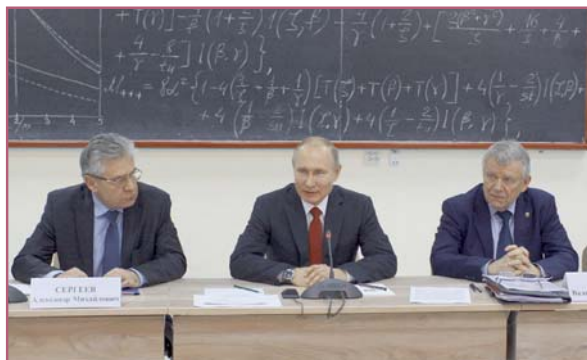
Президент РФ В. В. Путин во время встречи с учеными СО РАН в ИЯФе. 8 февраля 2018 г.