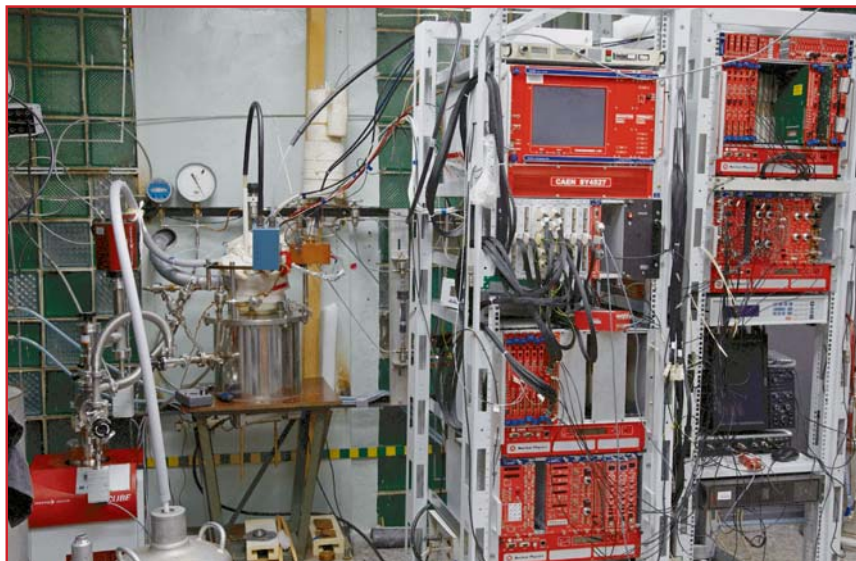
Двухфазный криогенный детектор и электроника систем питания и сбора данных

излучения возбужденных атомов в вакуумном ультрафиолете (длина волны порядка 128 нанометров), которое напрямую при помощи фотоэлектронных умножителей (ФЭУ) и кремниевых фотоумножителей (Si-ФЭУ) зарегистрировать нельзя. Поэтому, чтобы перевести излучение в видимую область, перед ФЭУ и Si-ФЭУ ставится оргстекло с нанесенными на него спектрсмещающими ве-