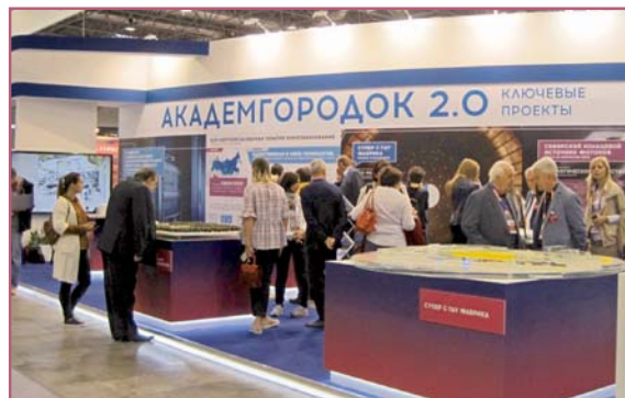
На Технопроме-2018 были представлены проекты будущих установок ИЯФа класса Mega-Science. 27 августа 2018 г.