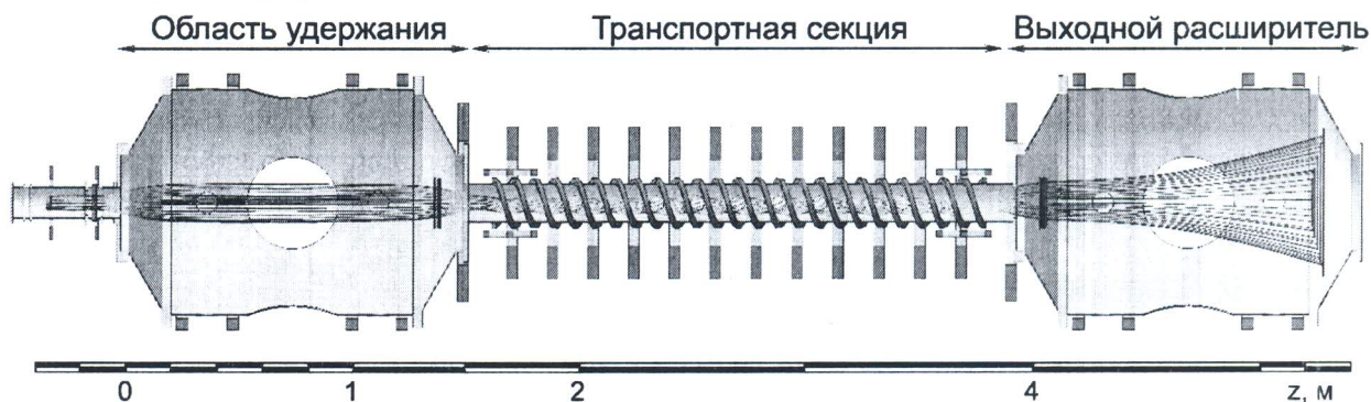
Рис. 1. Установка СМОЛА.